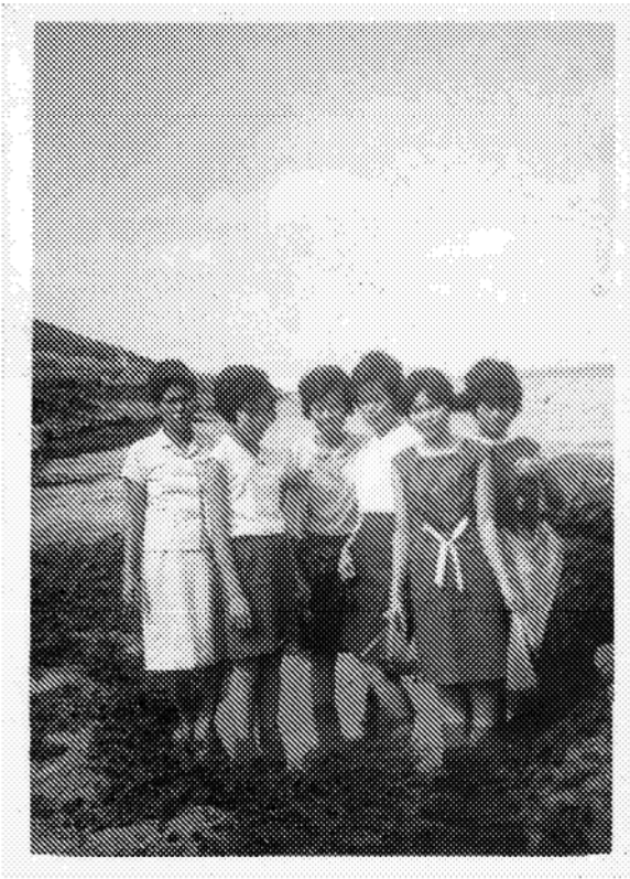
圖說（即電子檔名）：我的阿嬤（右三）年輕時可是超級潮的呢！